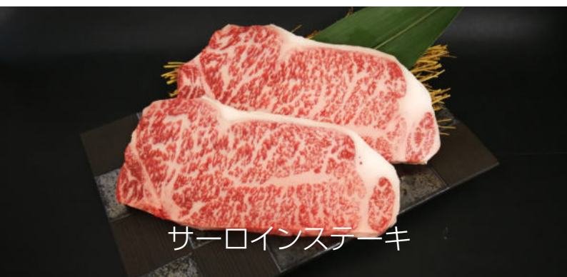
サーロインステーキ